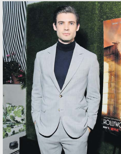
DAVID TIENE una tarea difícil por delante, al reemplazar a Henry Cavill como el Hombre de Acero. Su experiencia es principalmente en series de televisión y en plataformas de 'streaming', habiendo protagonizado varios originales de Netflix.

Pese a que no deja de ser curioso que House of Cards los una, Superman: Legacy será su debut como pareja cinematográfica. El 11 de julio de 2025 tendrán que demostrar si Gunn ha hecho bien en apostar por ellos para dar vida a dos personajes tan icónicos.